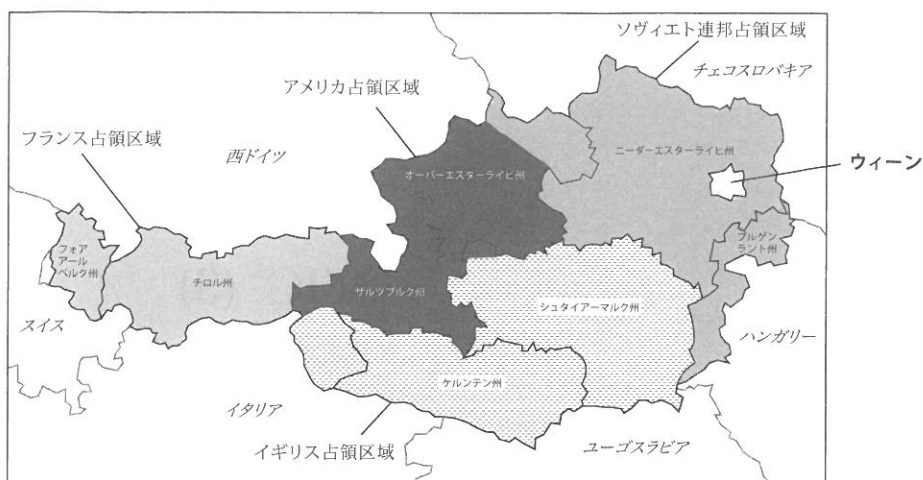
連合国 4 カ国によるオーストリアの占領 (1945年4月27日軍政下に、1955年10月26日占領終了。)